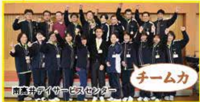
南高井デイサービスセンター