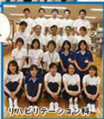
リハビリテーション科