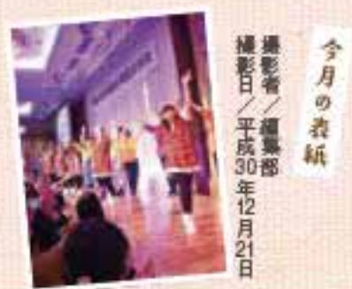
今月の表紙 撮影日/平成30年12月21日