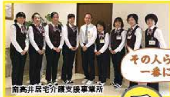
南高井居宅介護支援事業所